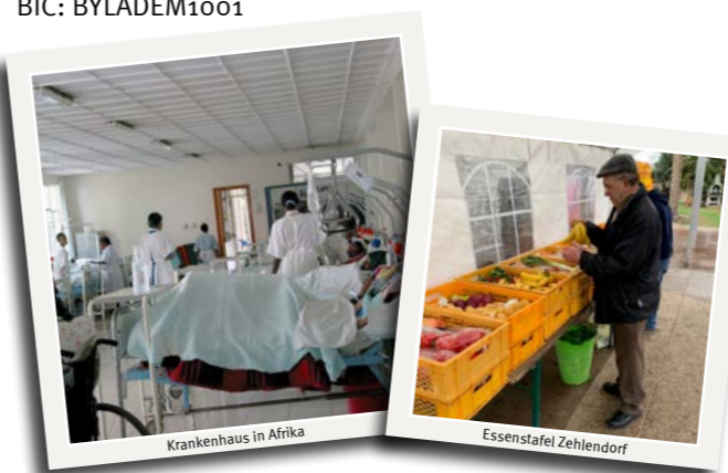
Krankenhaus in Afrika

Empfänger: Förderverein Krankenhaus Waldfriede e.V. Bankverbindung: DKB Bank IBAN: DE24 1203 0000 1020 1450 15 BIC: BYLADEM1001